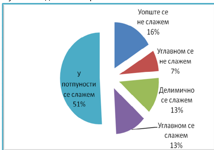
График 3. Простор за удружења младих и младе је обезбеђен и увек доступан младима на коришћење.

Чак 51% испитаника оцењује да је простор за младе обезбеђен и увек доступан младима